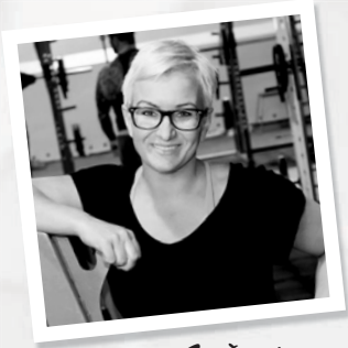
Sif Gardars Heilsu- og Einkaþjálfari

Í vinnu minni sem heilsu- og Einkaþjálfari leitast ég í grunninn við að fá skjólstæðinga mína til að borða hreina fæðu og með því að reyna ná fram hámarks nýtingu næringarefnanna.